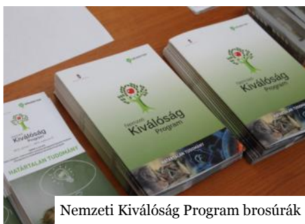
Nemzeti Kiválóság Program brosúrák