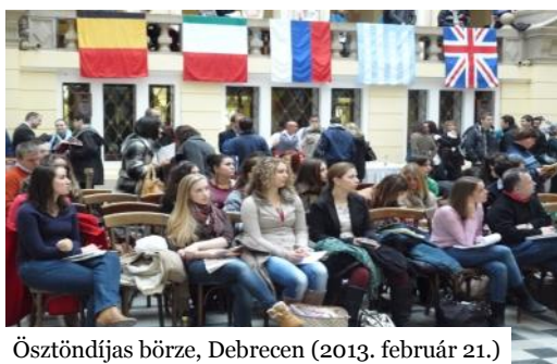
Ösztöndíjas börze, Debrecen (2013. február 21.)