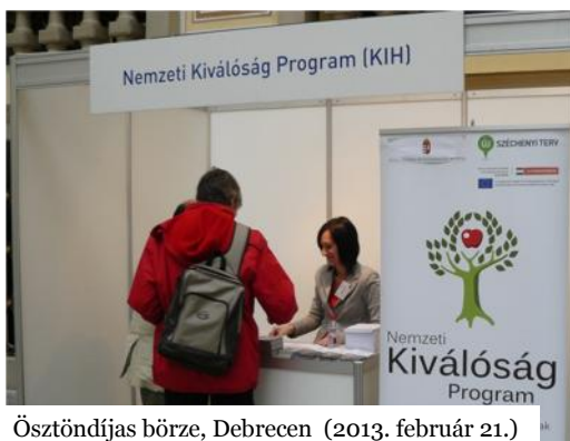
Ösztöndíjas börze, Debrecen (2013. február 21.)

Projektünkkel nemcsak papíron, vagy az interneten találkozhattak az érdeklődők, hanem számos rendezvényen is.