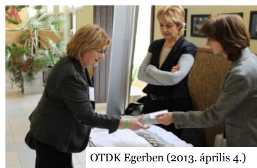
OTDK Egerben (2013. április 4.)