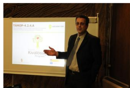
Állásbörze Egerben (2013. április 16.)

Regisztráljon informatikai rendszerünkbe!