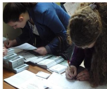
Ösztöndíjas börze Szegeden (2013. febr. 19.)